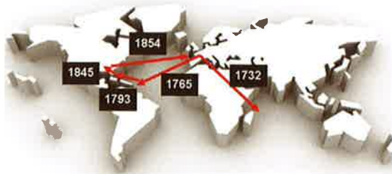
Flux migratoires de la famille Reynaud